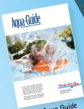
Rüegg's Aqua Guide